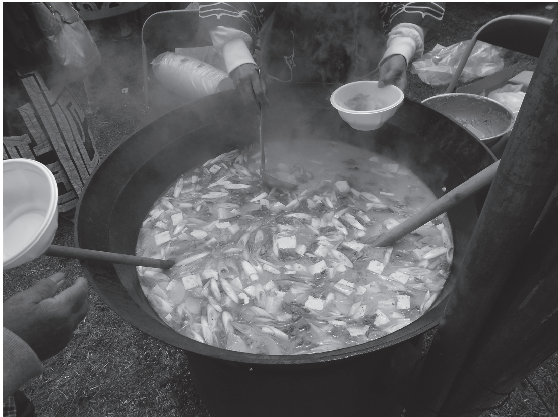
チェブオハウ(魚の入った汁物)

※現在、静内地方では、みそで味付けすることが、主流となっており、塩を使う味付けは、あまり行われておりません。