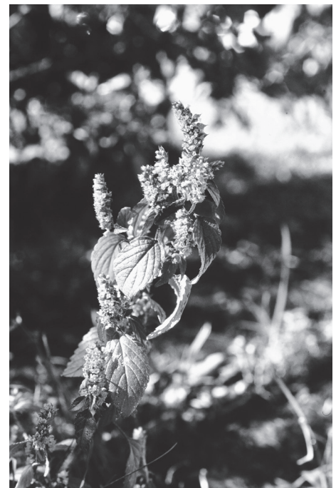
エント(なぎなたこうじゅ) (新ひだか町博物館所蔵)