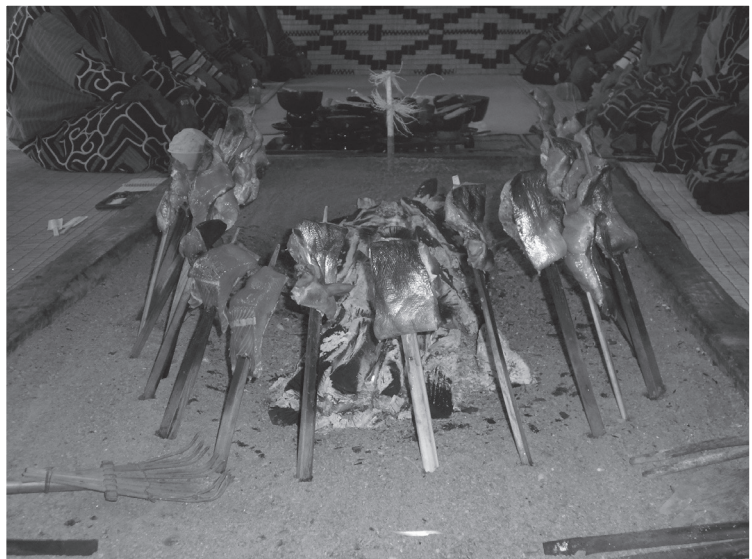
アマチェプ(焼き鮭)